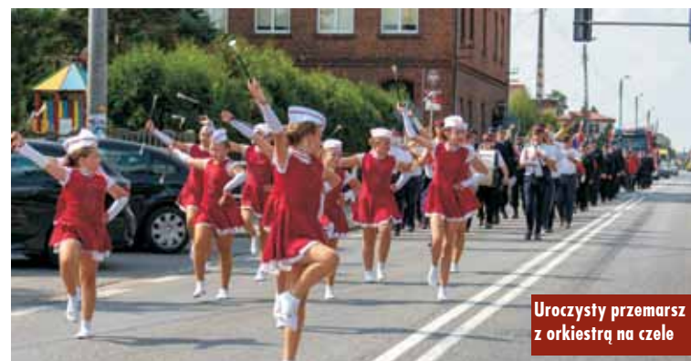
Uroczysty przemarsz z orkiestrą na czele