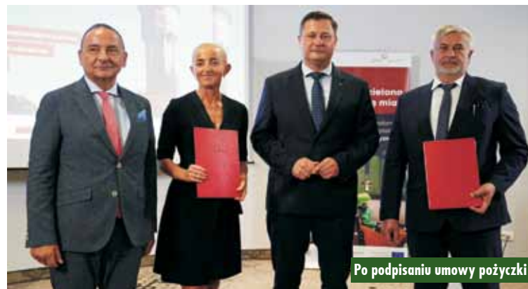
Po podpisaniu umowy pożyczki

Publikujemy cykl fotografii, na których w minionych latach uwiecznieni zostali mieszkańcy naszego regionu. Liczymy na to, że rozpoznają się oni na archiwalnych zdjęciach i napiszą do nas (e-mail: tygodnik@kepno.net), za co otrzymają nagrody książkowe.