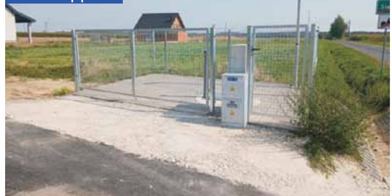
Nowa kanalizacja już działa