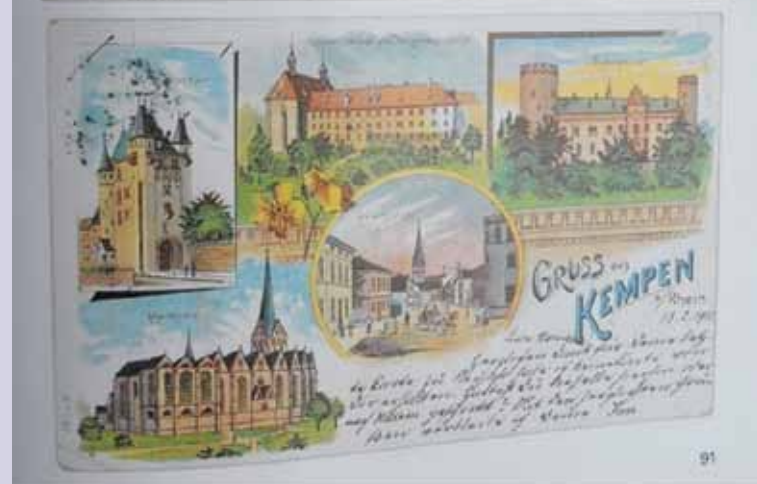
Kartki pocztowe niemieckiego Kempen z XIX wieku.