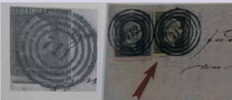
Stempel numerowy poczty Pruskiej z drugiej połowy XIX w. Kempen niemieckie 711 Kempen polskie 712

żany jest za patrona tego miasta. Zainteresowani tym faktem zaczęliśmy poszukiwać informacji na ten temat. Kempen to 35 tysięczne miasto w Niemczech w kraju związkowym Nadrenia Północna-Westfalia w rejonie Dusseldorf w powiecie Viersen (30 km na północny zachód od Dusseldorfu).