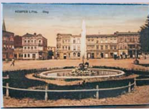
Kartka pocztowa z niemieckiego Kempen z XIX w.

wzmianka o niemieckim Kempen pochodzi z 1186 r., a o polskim Kępnie – z 1282 r. Podobne są też nasze