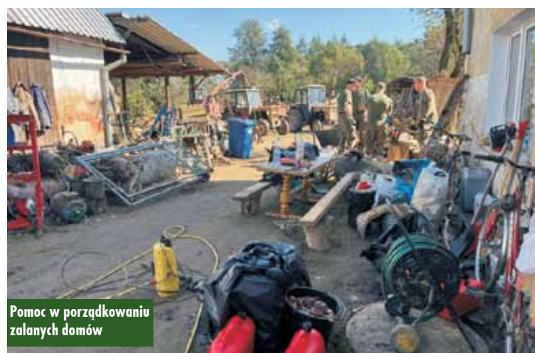
Pomoc w porządkowaniu zalanych domów

w piątek wyruszył od nas pierwszy samochód dostawczy wypełniony po brzegi setkami narzędzi, gotowych posiłków, środków chemicznych i higienicznych. Pojechały z nami także