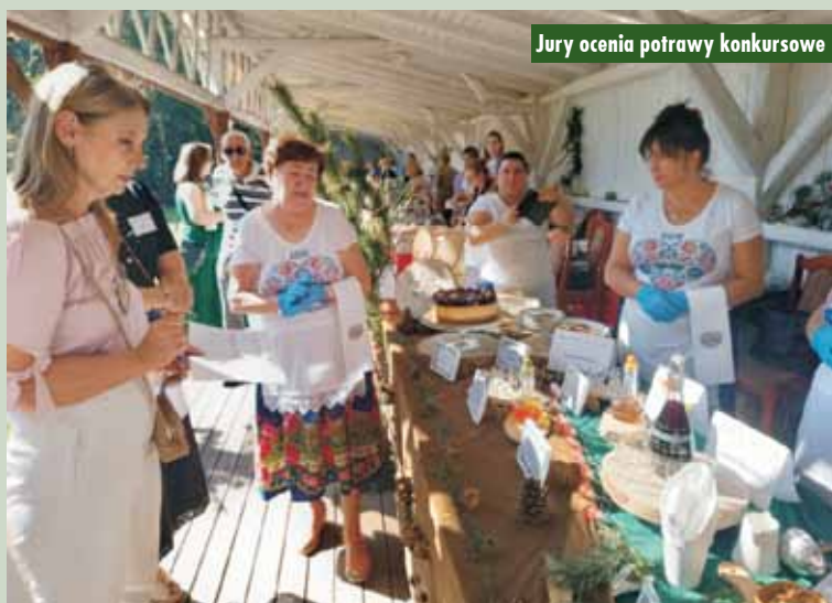
Jury ocenia potrawy konkursowe

22 września br. na Festiwal „Dary lasu” do Ustronia przybyło sporo osób z gminy i powiatu. Organizatorzy przygotowali dla nich mnóstwo atrakcji. Można było podziwiać pokazy rękodzielnicze garncarstwa i kowalstwa, na stoisku Stowarzyszenia Historycznego „Bataliony Obrony Narodowej” zobaczyć, jak funkcjonował szpital polowy i wyrobić sobie paszport, Klub Miłośników Starych Ciągników zaprezentował stare pojazdy, a na stoisku Leśnego Zakładu Doświadczalnego przygotowano gry i zabawy dla dzieci oraz dorosłych. Zespół Szkół Ponadpodstawowych nr 1 z Kępna zaprosił na przekąski z wegańskimi pastami, a licznych smakoszy można było spróbować na