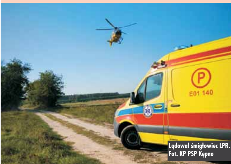
Lądował śmigłowiec LRP.

22 września br. dyżurny Komendy Powiatowej Policji w Kępnie otrzymał informację, że uczestniczący w wypadku 16-letni motorowerzysta zmarł. Postępowanie w tej sprawie prowadzi KPP Kępno. Oprac. KR