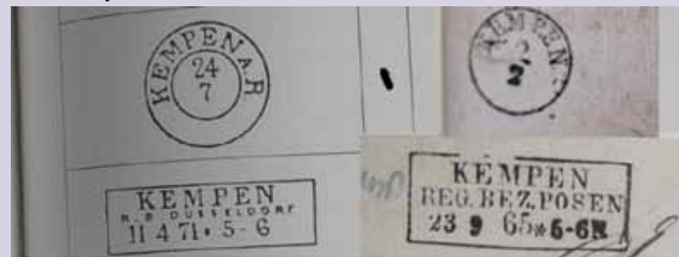
Przykładowe stemple poczty Pruskiej z XIX w. Niemieckie Kempen Polskie Kempen