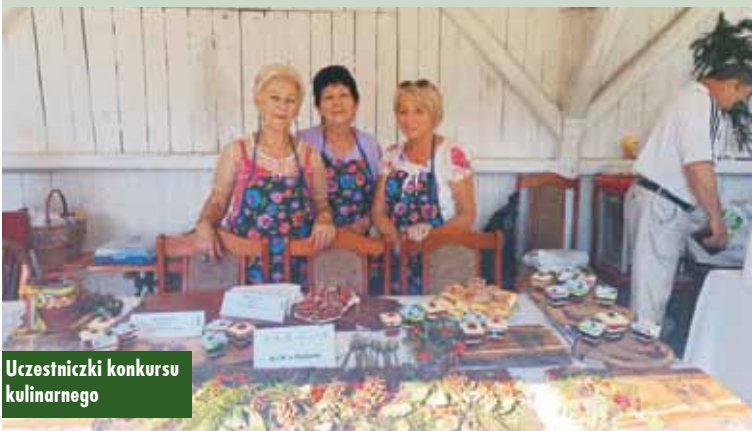
Uczestniczkę konkursu kulinarnego