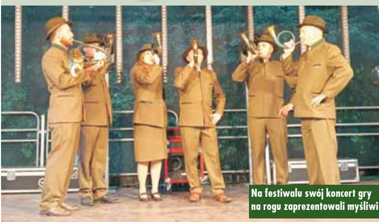
Na festiwalu swój koncert gry na rogu zaprezentowali myśliwi

stoiskach kulinarnych. Na scenie pojawiły się zespoły i chóry z powiatu kępińskiego.