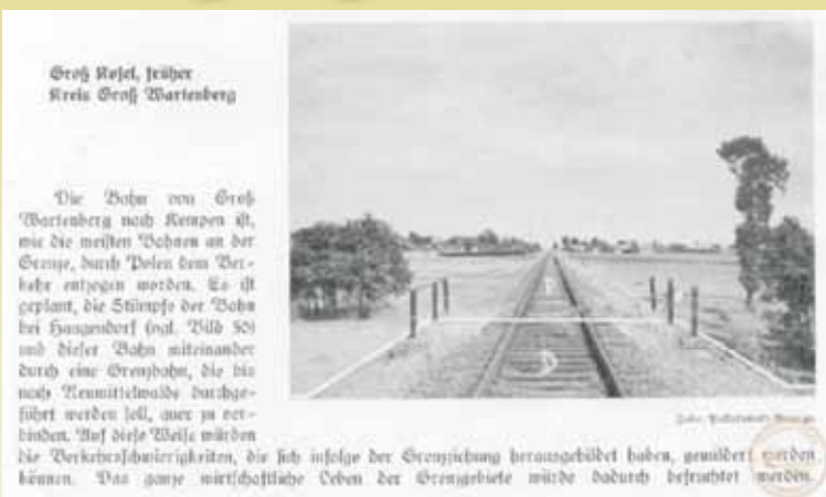
Granica między II Rzeczpospolitą a Niemcami na trasie kolejowej między Bralinem a Sycowem