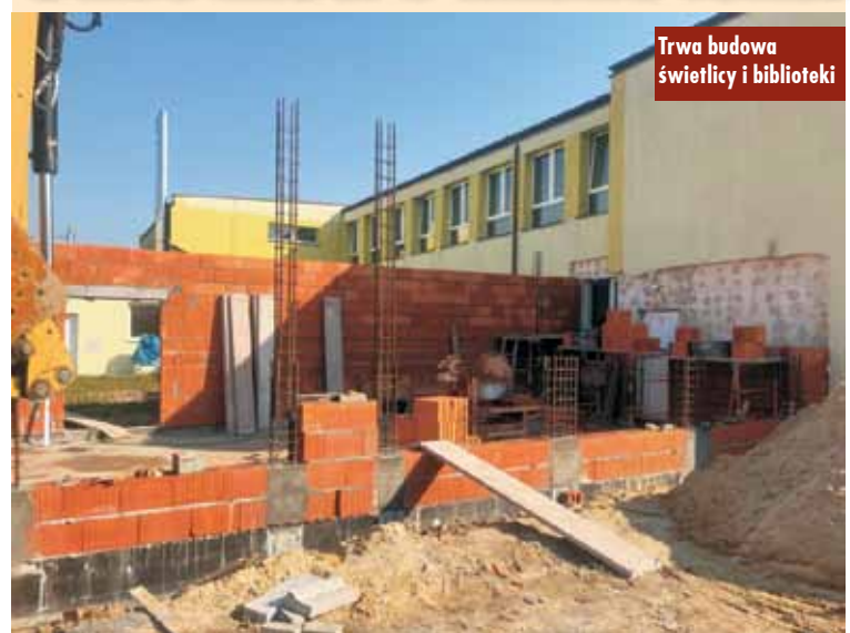
Trwa budowa świetlicy i biblioteki

Prace budowlane w ramach zadania „Rozbudowa Szkoły Podstawowej w Trębaczowie” nie zwalniają. Wykonawca robót przeniósł główny front robót na zewnątrz i rozpoczął budowę nowego skrzydła. Wykonano już fundamenty oraz rozpoczęto wznoszenie ścian. W nowej części budynku znajdzie się miejsce