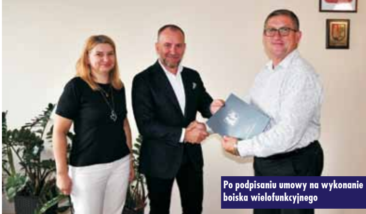
Po podpisaniu umowy na wykonanie boiska wielofunkcyjnego

Rozstrzygnięty został przetarg na realizację inwestycji „Budowa boiska wielofunkcyjnego w Łęce Opatowskiej wraz z kortem tenisowym, infrastrukturą towarzyszącą oraz zagospodarowaniem terenu”. 10 września br. została podpisana umowa z wykonawcą zadania – firmą Tamex Obiekty Sportowe S.A. z Warszawy. Zgodnie z umową, w ciągu jedenastu miesięcy powstanie nowe boisko wielofunkcyjne o wymiarach 22 x 42 m ze sztuczną nawierzchnią syntetyczną oraz kort tenisowy o wymiarach