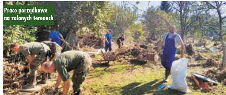
Prace porządkowe na zalanych terenach

nych w powodzi. Dzięki kontaktom z mieszkańcami i ich rodzinami szybko poznaliśmy najpilniejsze potrzeby mieszkańców, a odzew naszych parafian (i nie tylko) przekraczał nasze wyobrażenia. W szybkim tempie zgromadziliśmy pierwsze dary. Już