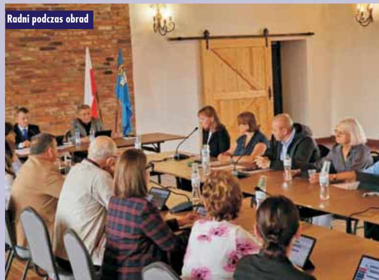
Radni podczas obrad

lat. - Przewidywana reorganizacja sieci szkół w gminie Baranów nie pogorszy warunków do nauki i nie ograniczy powszechnej dostępności do nauki, a wręcz poprawi warunki funkcjonowania młodszych dzieci w budynku parterowym Szkoły Podstawowej w Łęce Mroczeńskiej. O ile nauka w niewielkich oddziałach szkolnych tworzy korzystne warunki