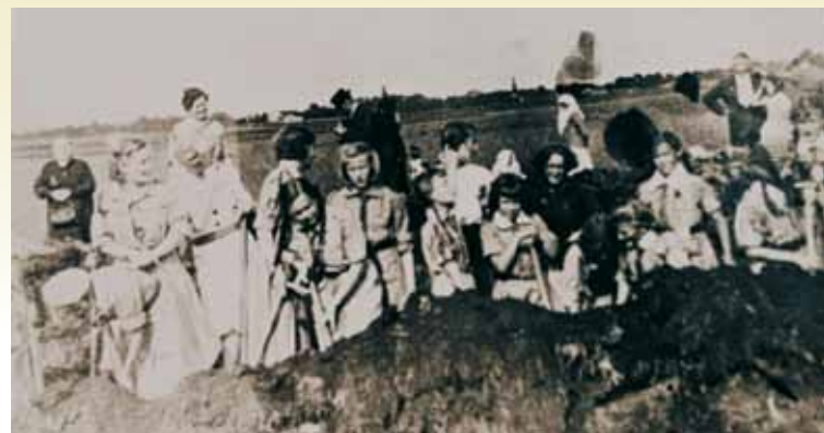
Kopanie rowów przeciwczołgowych na obrzeżach Kępna przez harcerki, w tle widać wieżę kościoła katolickiego i ewangelickiego.