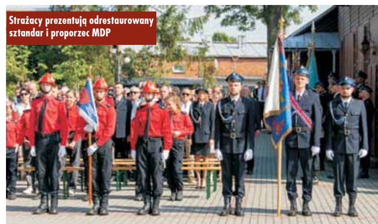
Strażacy prezentują odrestaurowany sztandar i proporzec MDP