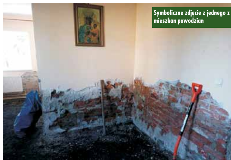
Symboliczne zdjęcie z jednego z mieszkań powodzian

Nie ustajemy w niesieniu pomocy, ale jest ona możliwa tylko dzięki Państwu. W niedzielę całą tak zwaną tacę parafia przeznaczyła dla powodzian, dodatkowo puszka wystawiona jest w Domu Katolickim, gdzie też cały czas pracują wolontariusze odbierający, sortujący i pakujący dary. Wozimy tylko rzeczy zgodne z zapotrzebowaniem, wszystkie inne pozostawiając na kolejne wyjazdy. Zbieramy także deklaracje mebli, materiałów budowlanych itp., które pojedą zaraz po osuszeniu. Pilnie poszukiwane są osuszarki. Trwajmy w pełnej mobilizacji. Nasza pomoc będzie jeszcze długo potrzebna.