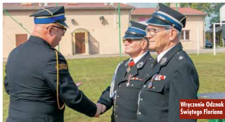
Wręczenie Odznaki Świętego Floriana