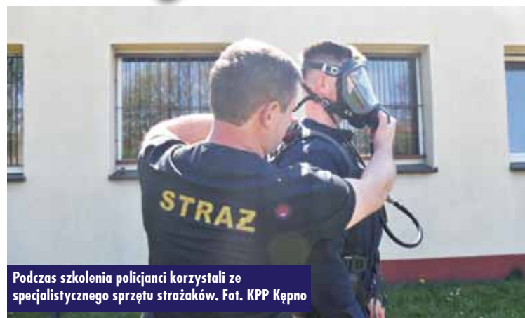
Podczas szkolenia policjanci korzystali ze specjalistycznego sprzętu strażaków.