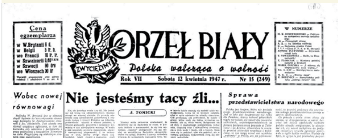
Fragment strony tytułowej pisma emigracyjnego „Orzeł Biały”, 1947 r.