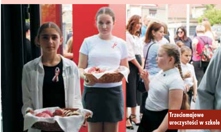
Trzeciomajowe uroczystości w szkole