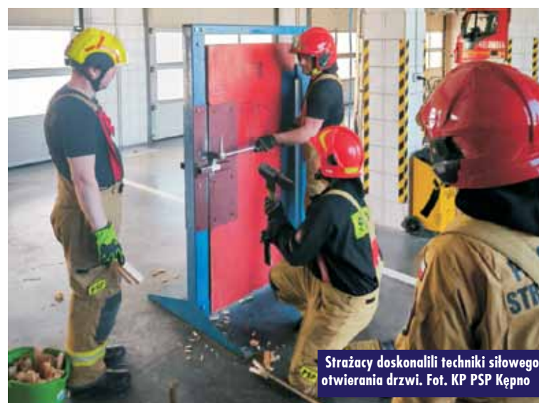
Strażacy doskonalili techniki siłowego otwierania drzwi.

Praktyka siłowego otwierania drzwi jest niezwykle istotna w pracy strażaków oraz policjantów, którzy często muszą radzić sobie z sytuacjami, gdzie szybki dostęp może mieć kluczowe znaczenie dla ratowania życia, zdrowia lub mienia. Dzięki zaangażowaniu i profesjonalizmowi