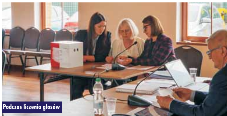
Podczas liczenia głosów