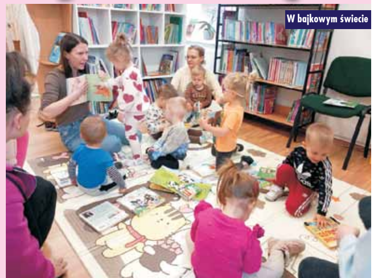
W bajkowym świecie

Podpisano umowę na budowę kolejnego odcinka kanalizacji w Siemianicach