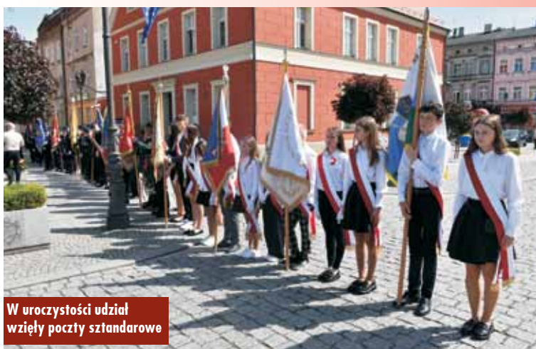
W uroczystości udział wzięły poczty sztandarowe

W Komendzie Powiatowej Państwowej Straży Pożarnej w Kępnie odbyły się warsztaty pn. „Otwórz by ratować”