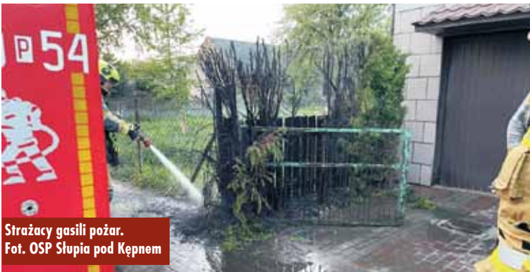
Strażacy gasili pożar.