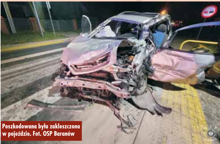
Poszkodowana była zakleszczona w pojeździe.

2 maja br., o godzinie 23.37, do Stanowiska Kierownika Komendanta Powiatowego Państwowej Straży Pożarnej w Kępnie wpłynęło zgłoszenie o zdarzeniu drogowym na ul. Krajowej w Mroczeniu. Na miejsce zdarzenia zadysponowano zastępy z Jednostki Ratowniczo-Gaśniczej w Kępnie, OSP Mroczeń i OSP Baranów.