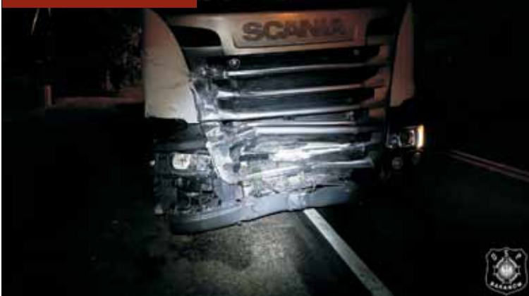
W wypadku udział brał samochód ciężarowy.

Pożar na posesji przy ul. Dworcowej w Słupi pod Kępnem