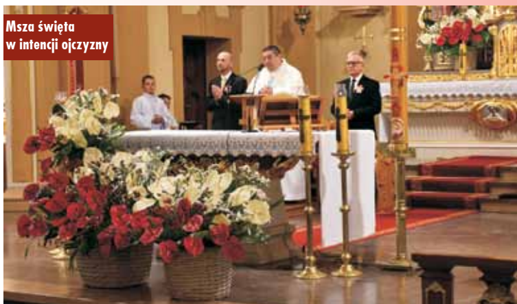
Msza święta w intencji ojczyzny