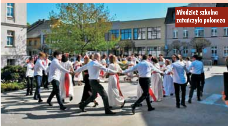
Młodzież szkolna zatańczyła poloneza

W ten sposób, poprzez uroczyste obchody, oddajemy hołd Konstytucji 3 Maja oraz wszystkim tym, którzy walczyli i poświęcili się dla niepodległej ojczyzny. Niech to święto będzie dla nas wszystkich okazją do budowania lepszej, bardziej sprawiedliwej i suwerennej Polski, godnej naszej historii i przyszłości. Oprac. KR