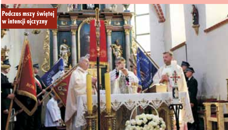
Podczas mszy świętej w intencji ojczyzny