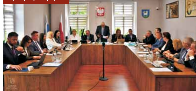
Podczas pierwszej sesji nowej Rady Miejskiej Gminy Rychtał

6 maja br. odbyła się pierwsza sesja nowo wybranej Rady Miejskiej Gminy Rychtał na kadencję 2024-2029.