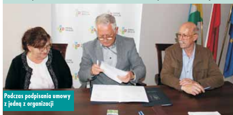
Podczas podpisania umowy z jedną z organizacji

Podpisanie umowy na wykonanie zadania inwestycyjnego pn. „Budowa chodnika z kostki betonowej przy placu zabaw w Bralinie”