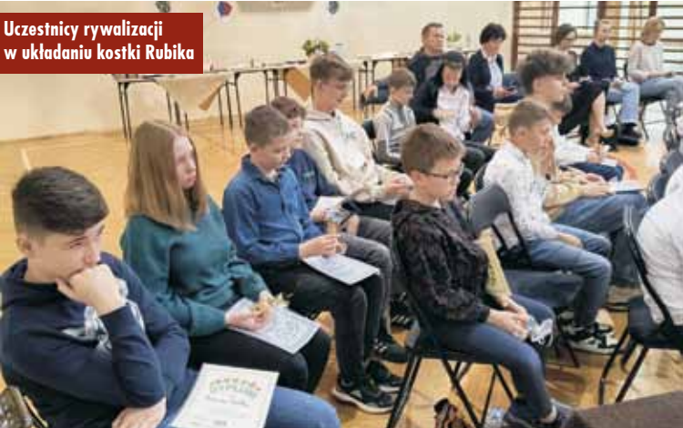
Uczestnicy rywalizacji w układaniu kostki Rubika