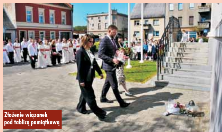
Złożenie wiązanek pod tablicą pamiątkową

uczcić pamięć Konstytucji 3 Maja. Na uroczystości nie zabrakło tradycyjnych elementów, które symbolizują polskość i patriotyzm. Dzieci