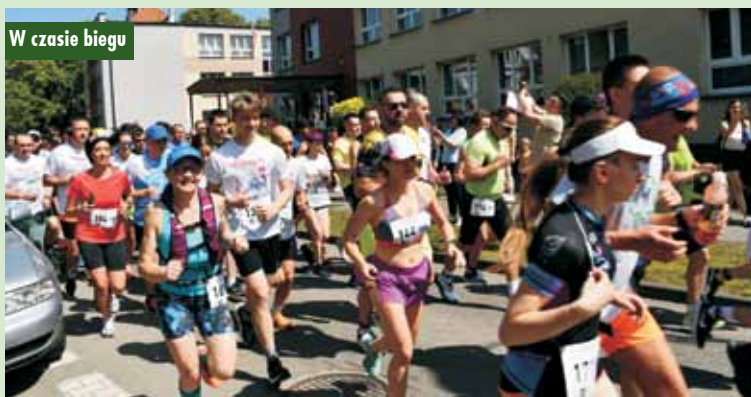
W czasie biegu

W Szkole Podstawowej nr 3 w Kępnie odbył się II Międzyszkolny Konkurs Układania Kostki Rubika