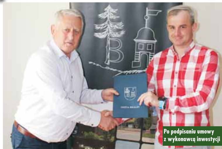
Po podpisaniu umowy z wykonawcą inwestycji